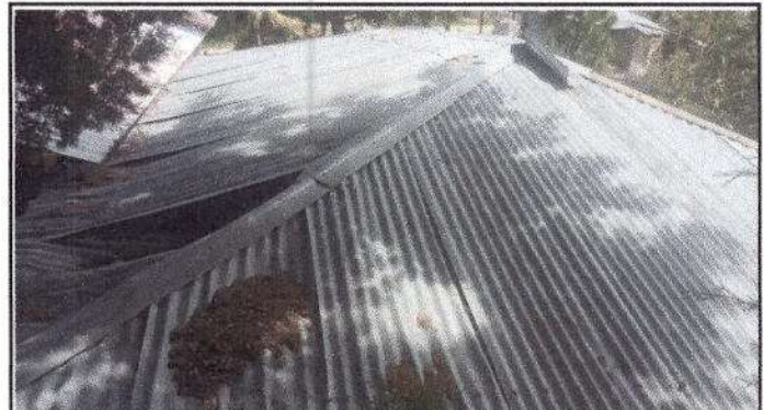
Foto 4: Estructura de Techo-Sustitución lamina por lamina troquelada aluzinc calibre 26