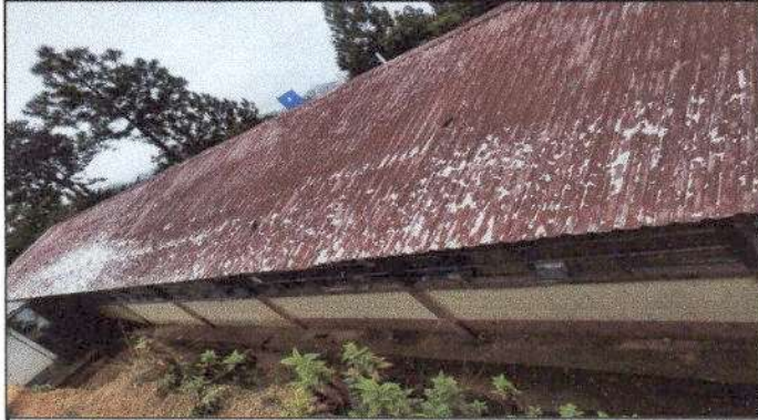
Foto1: Sustitución de Lamina, por lamina troquelada aluzinc calibre 26